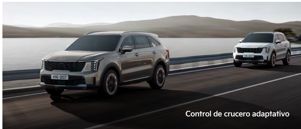
Control de crucero adaptativo