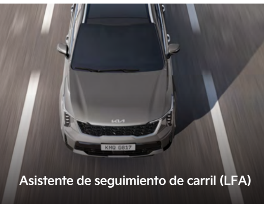
Asistente de seguimiento de carril (LFA)