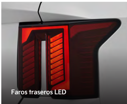
Faros traseros LED