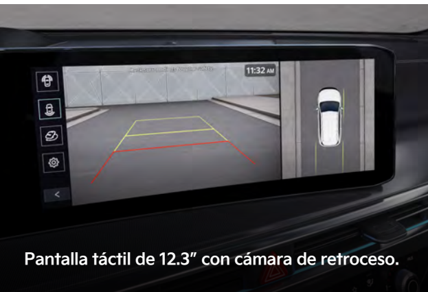
Pantalla táctil de 12.3" con cámara de retroceso.