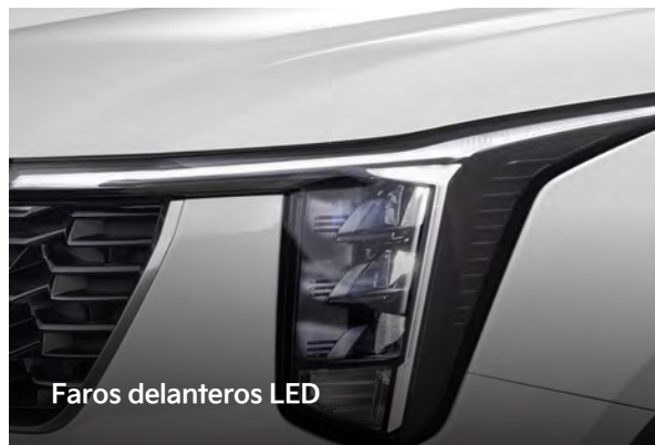
Faros delanteros LED